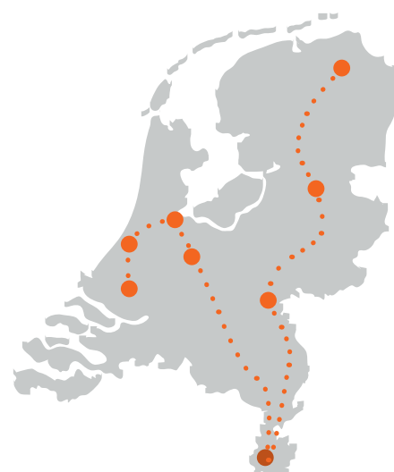
Collegetour O²PZ voor alle 8 faculteiten