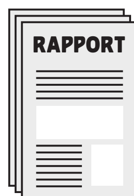
Status palliatieve zorg onderwijs in Nederland

Dit project faciliteert optimalisatie trajecten t.a.v. palliatieve zorg per universiteit - zie boven. Daarnaast jaagt het de landelijke beweging aan via een publicatie 'inventarisatie palliatieve zorg binnen WO' en college-tour O²PZ.