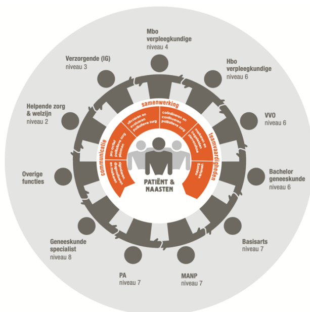
Interprofessioneel samenwerkingsmodel palliatieve zorg

De voorgestelde competenties en EPA's voor studenten VVO MANP en PA maken integraal deel uit van het addendum op het Onderwijsraamwerk palliatieve zorg 2.0 dat voor verzorgenden, verpleegkunde en artsen geneeskunde voor alle opleidingsniveaus 2 t/m 8 zijn uitgewerkt. Dit raamwerk gaat uit van een interprofessionele benadering van palliatieve zorgverlening. Hierbij kunnen taken c.q. activiteiten door verschillende zorgprofessionals worden uitgevoerd.