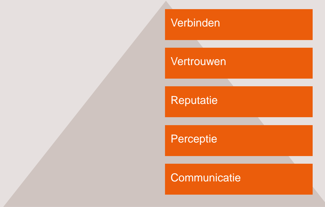
Piramide van vertrouwen